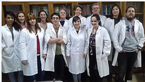
El equipo de investigadores de la UCM.

Los científicos han identificado una mutación en el gen TBX20 que codifica el factor de transcripción Tbx20. Los resultados han demostrado que dicho factor regula, a su vez, la expresión del gen KCNH2 , que codifica la expresión de una proteína (Kv11.1). Dicha proteína forma unas estructuras (canales iónicos) en las células cardíacas que permiten el paso de iones potasio.